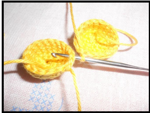
Faire la ms dans le 2 ème cercle