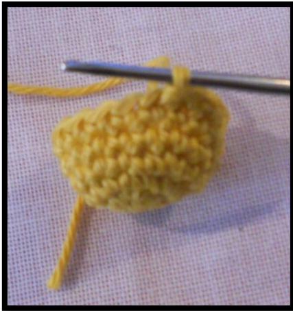
Faire la mc